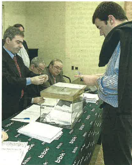
Un cliente deposita su voto en los anteriores comicios.

Por último, expresa su respaldo al actual modelo de gestión, “basado en el buen gobierno, la austeridad, la transparencia y la solidaridad. Añade que es una filosofía que no ha funcionado en el resto del Estado, pero sí en Euskadi”. >DEIA